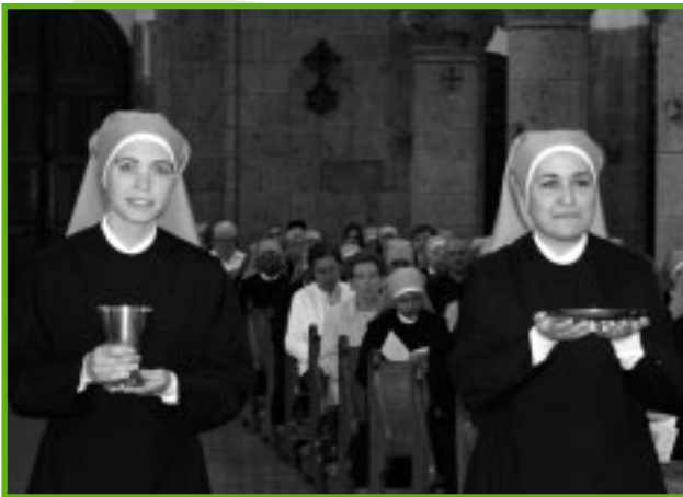
Dos novicias el día de su Profesión temporal el pasado 11 de julio en la Casa Madre.

¡Qué hermoso es ver a una joven reconocer bajo la luz del Espíritu, la verdad de su vida personal que consiste en darse en una vocación y en realizar el don de sí dejando todo por Dios siguiendo su llamada!