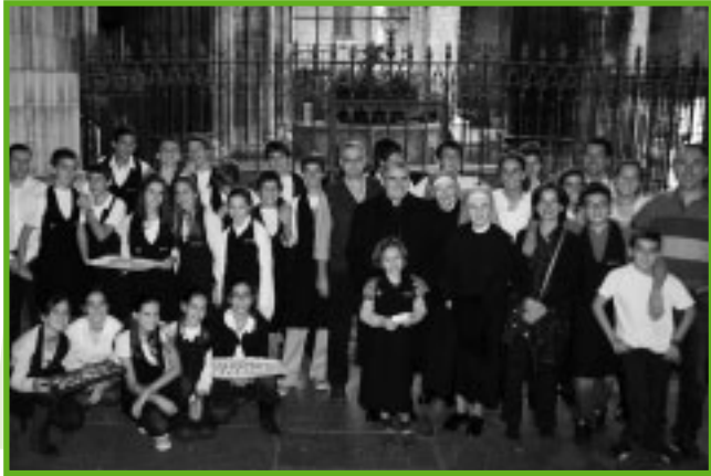
El grupo de jóvenes camareros voluntarios posa junto al Cardenal.