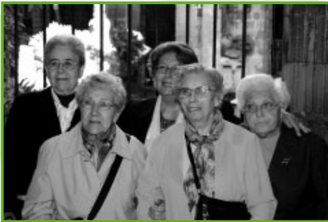
Residentes de Barcelona felices de compartir esta fiesta.