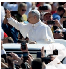
Papa León XIV