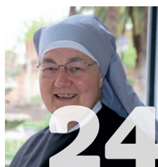
Sor Agnès Blandine