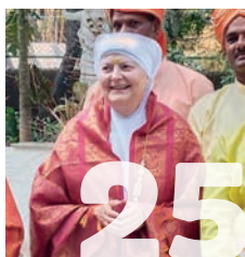
Viaje Madre General a la India